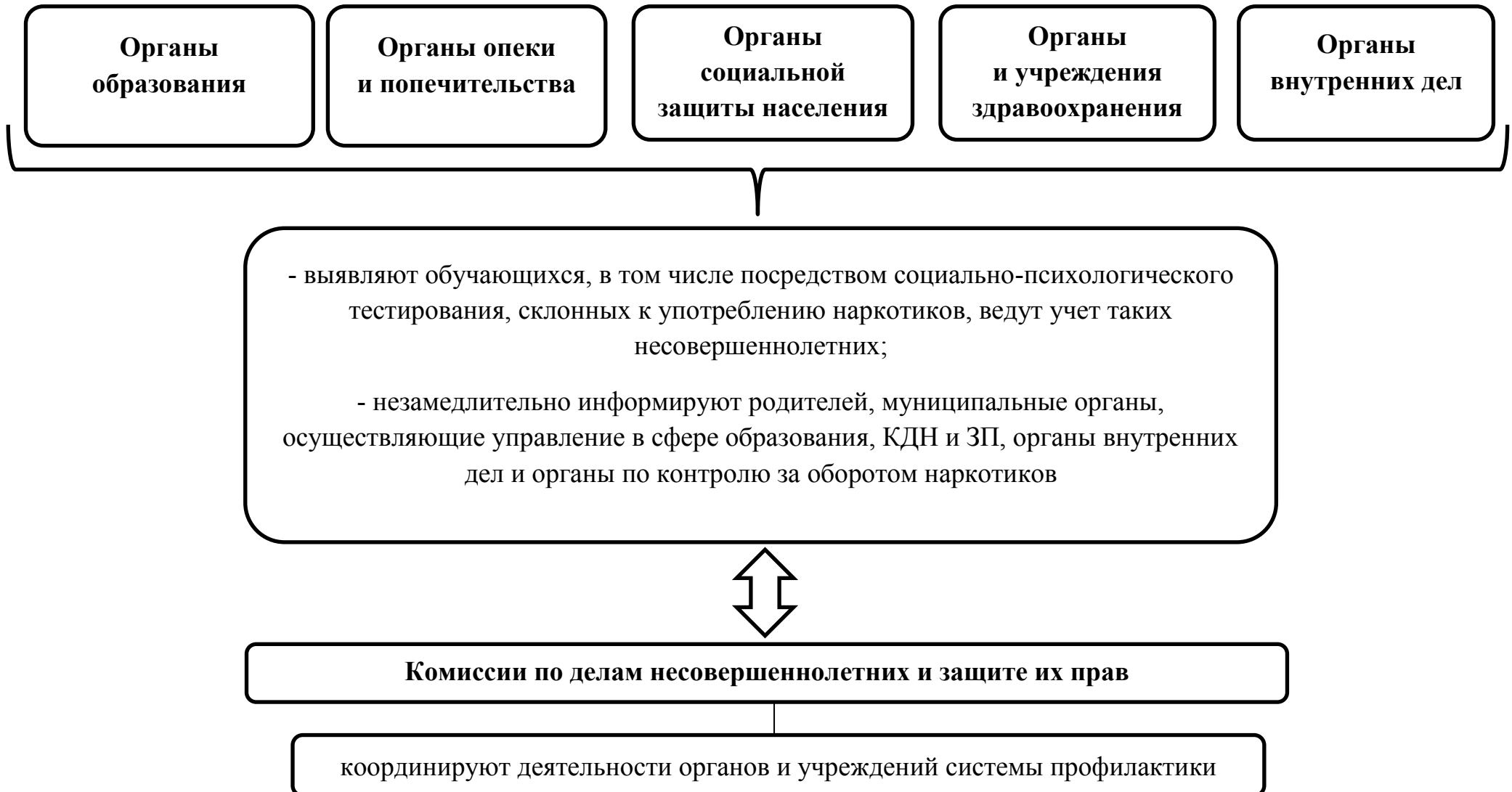
Схема 1. Выявление несовершеннолетних, употребляющих психоактивные и наркотические вещества, субъектами системы профилактики