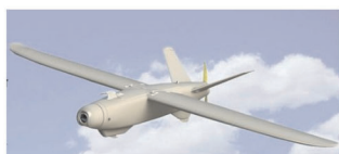
дрон самолётного типа