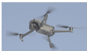
дрон вертолётного типа